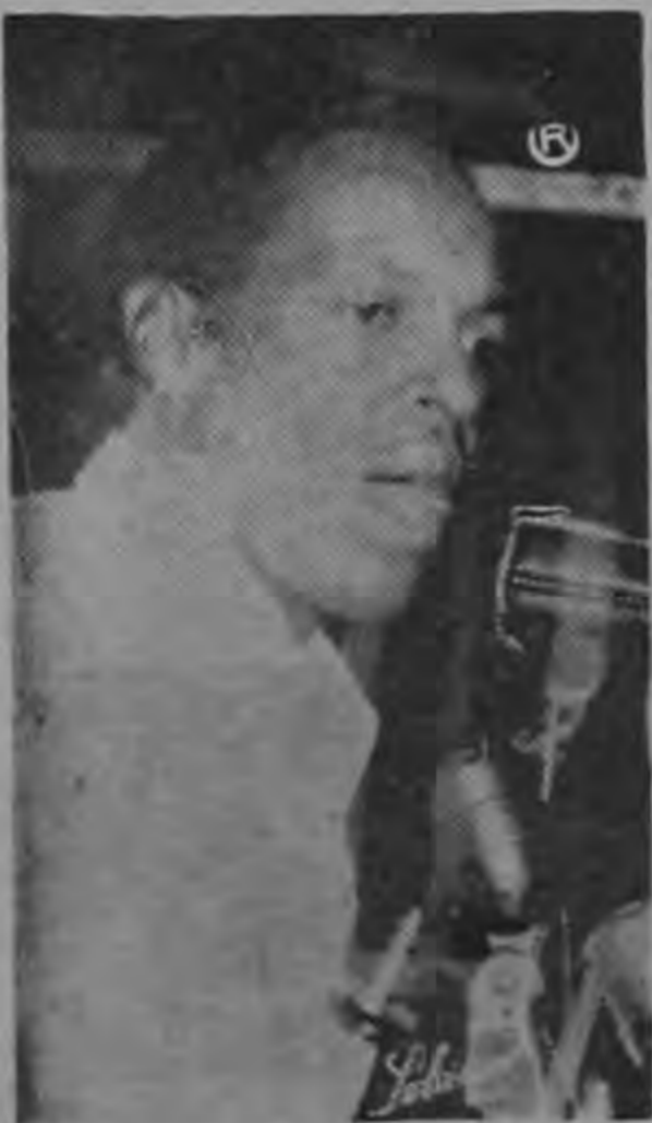
BERMUDEZ ...condonar el receso...

Aunque los oradores dieron comienzo a las ocho y media de la noche, desde las siete comenzaron a situarse frente a Radio Casino, hombres mujeres y niños que expresaban en distintas formas su inconformidad por el prolongado debate que en la Asamblea Legislativa está dándose al negocio; pero mayores críticas se hizo el Poder Legislativo ante el anuncio del receso decretado, precisamente cuando el caso demanda la atención de los señores diputados. Manifestaron los asistentes que un receso puede acordarse en cualquier mes del año, pero no en los precisos momentos en que urge una definición sobre un proyecto que no viene únicamente a sacar a la Provincia de Limón de su desastrosa ruina económica, sino que disposiciones incluídas en el mismo permitirán al Gobierno efectuar distintas