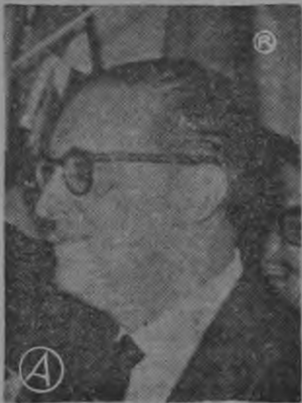
Gobernador LACERDA... está siendo atacado violentamente...

LIMA 4 (AP) — El matutino "La Prensa" señala en un editorial que el Gobernador Brasileño del Estado de Guanabara, Carlos Lacerda, "el más firme combatiente contra la penetración comunista en su país y en América", está siendo objeto de una ofensiva comunista.