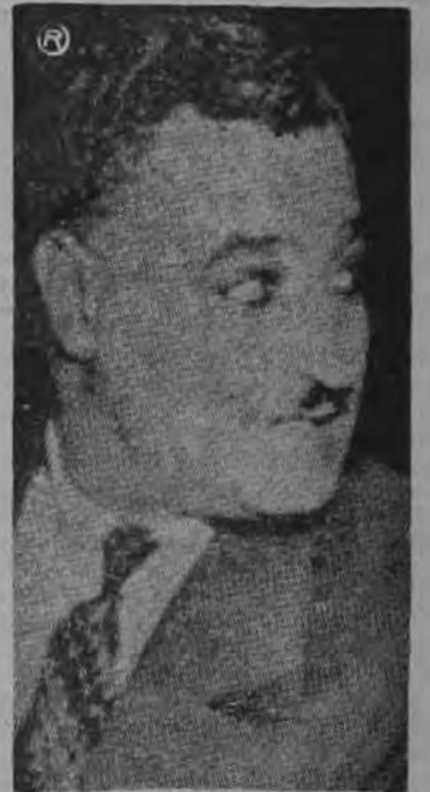
...conspiraciones y sublevaciones le son achacadas...

DAMASCO 4 (AP) — Las autoridades serias dicen haber descubierto un complot supuestamente manejado por la embajada de la República Árabe Unida en Beirut para realizar asesinatos políticos y sabotajes con explosiones de bombas en todo Siria.