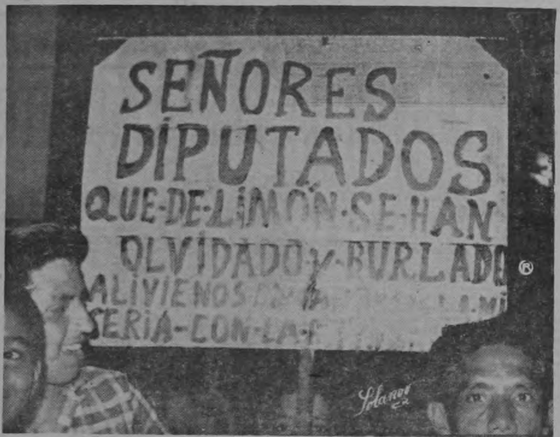
Cartelones que circularon en Limón