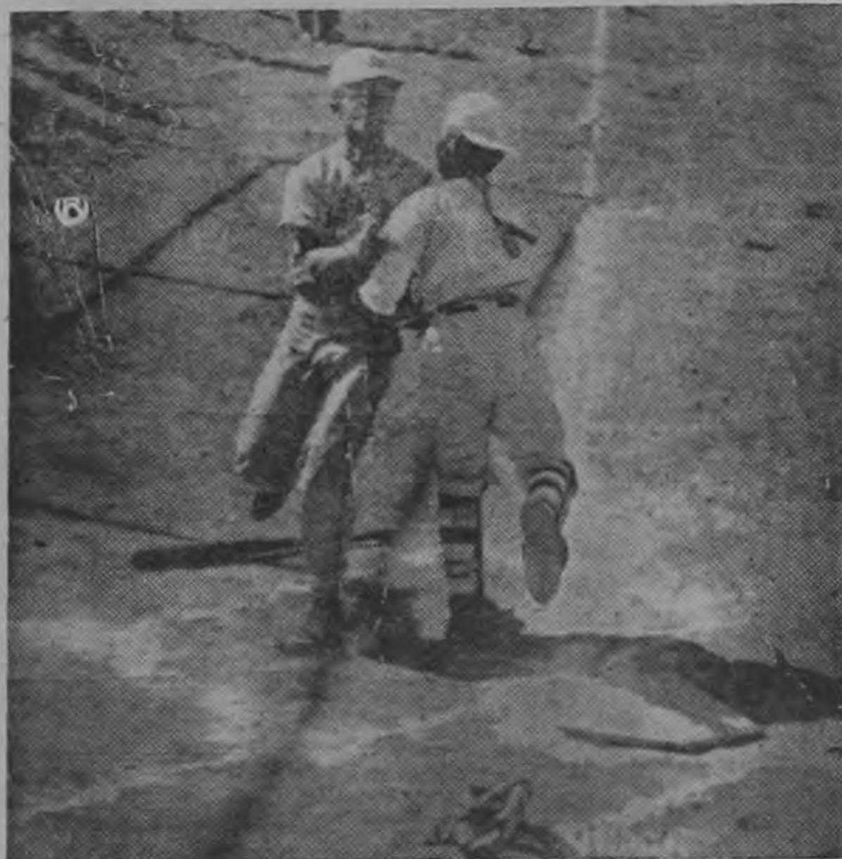
Este fue uno de los outs en home que se produjeron en el juego entre Viceitas y Suerres que terminó con el triunfo de los primeros por ocho carreras contra cero. Con estos dos encuentros se declaró inaugurada la temporada oficial de béisbol menor.