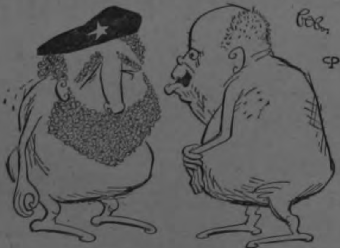
¿ESTA UD. RIENDOSE?

El Presidente también aprobó hoy los artículos de constitución de la corporación de comunicaciones por satélites.