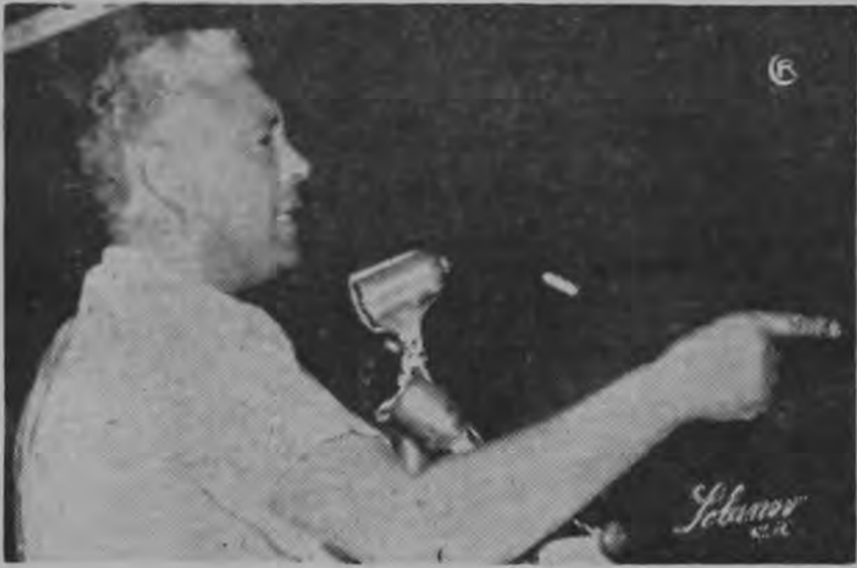
REUBENS ...huelga general...

La noche del sábado, conforme se había anunciado se efectuó en Limón la gran concentración frente a Radio Casino. Miles de portueños se reunieron para demostrar una vez más dos cosas indiscutibles: la situación económica de ese pueblo y la urgencia de que se dé aprobación al proyecto de instalación de la refinería de petróleo,