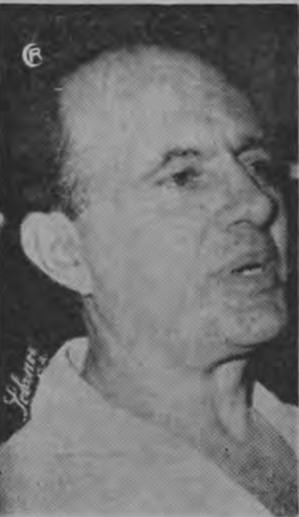
DE LA PEÑA ...situación agobiadora...

Combatamos esas fuerzas negativas que se oponen a cualquier industria ya sea en Puntarenas, Alajuela, Heredia o cualquiera otra provincia.