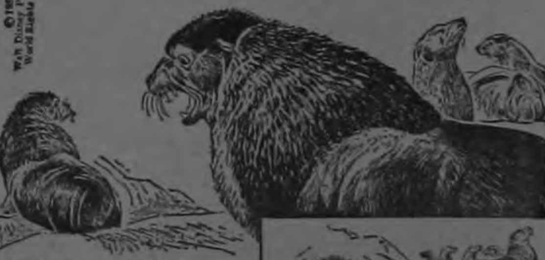
...PERO NO DEL TODO UNA DE LAS ESPOSAS SE ENAMORA DEL VENCIDO Y LO SIGUE PARA FORMAR EL NÚCLEO DE SU FUTURO HAREN.

©25 Distributed by King Features Syndicate.