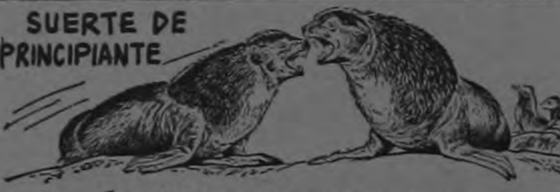
ESTA FOCA MACHO SOLTERA PELEA CON EL PROPIETARIO DE UN HAREN POR SUS ESPOSAS Y PIERDE...