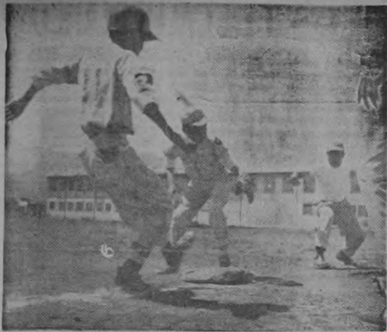
Huetares derrotaron a Terrabas en los juegos de Liga Menor celebrados el domingo en la Plaza González Víquez. Aquí vemos a uno de los pequeños bateadores de la novena Terraba logrando embasarse por tiro defectuoso a la inicial. El resultado final de tres a cero.